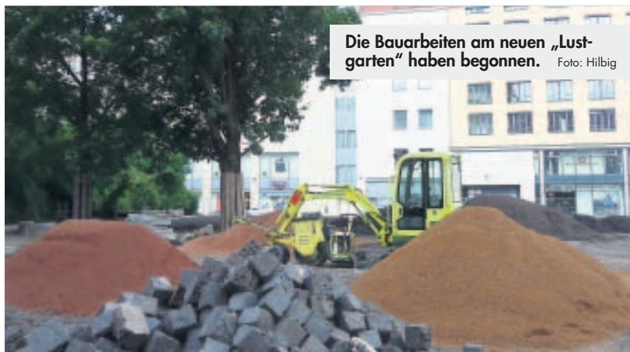
Die Bauarbeiten am neuen „Lustgarten“ haben begonnen.

Von 2005 bis 2008 wurde die damals noch größere unbebaute Fläche bereits mit verschiedensten Aktionen, Akteuren und Aufenthaltsbereichen, auch unter Beteiligung des City Managements, als „Lustgarten“ gestaltet. Nun wird auf der kleineren Freifläche ein intimerer Bereich entstehen, der aber auch künftig für Aktivitäten genutzt werden soll. Die Berlinhaus GmbH unterstützt maßgeblich die Umsetzung der städtischen Planung.