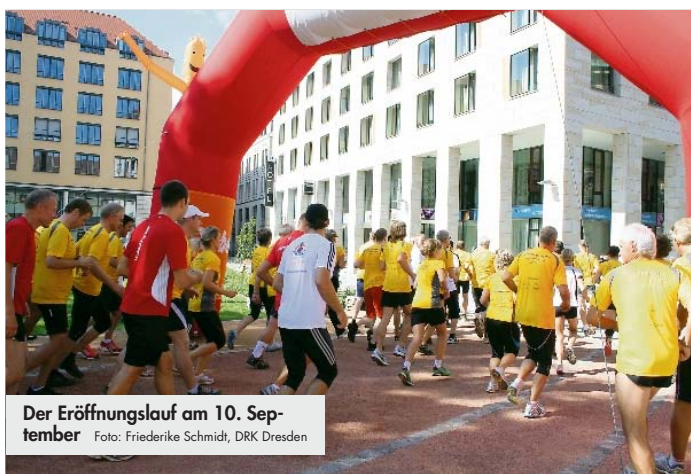
Der Eröffnungslauf am 10. September

Der Rundkurs ist ausgeschildert, jederzeit zugänglich und eignet sich sowohl für Läufer als auch für Nordic-Walker und Spaziergänger. Darüber hinaus finden zu